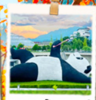
แพนด้าเซลล์