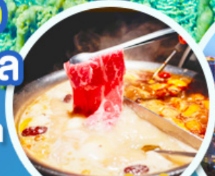
ชาบูหม่าล่า