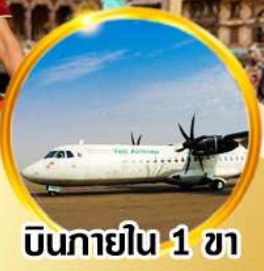
บินภายใน 1 ขา