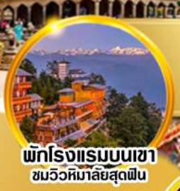
พักโรงแรมบนเขา ชมวิวหิมาลัยสุดฟิน