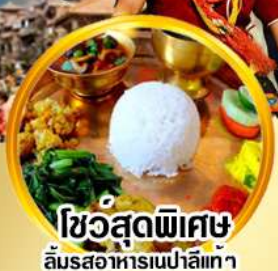
ไขว้สุดพิเศษ ลิ้มรสอาหารเนปาลแท้ๆ

ดินแดนศักดิ์สิทธิ์กลางห้อมกอดหิมาลัย สัมผัสสถาปัตยกรรมอันวิจิตรงดงาม กาฐมัณฑุ ไคลาสา ภัคตาปัวร์ ปาหั้น นาคากีอต