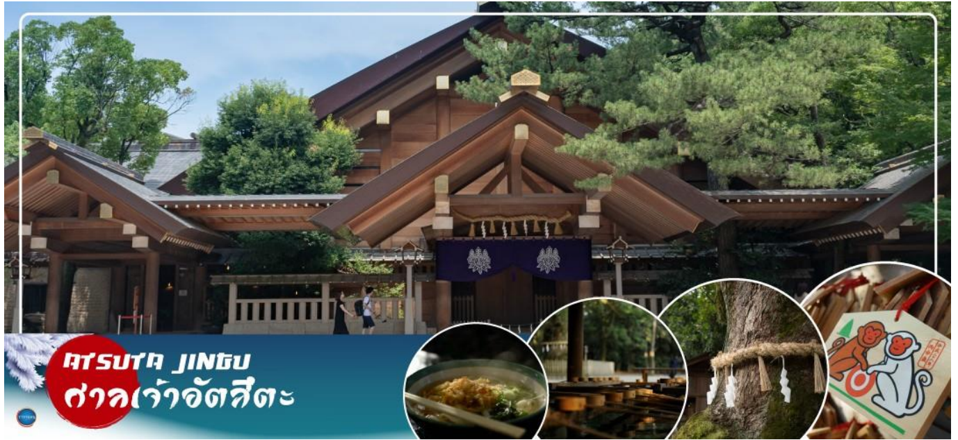
ATSUTA JINGU ศาลเจ้าอัตสึตะ