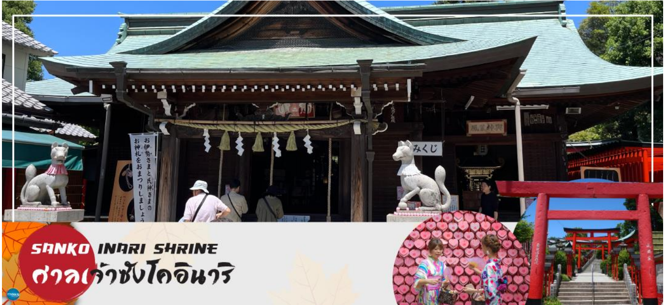
SANKO INARI SHRINE ศาลเจ้าซังโคอินาริ

จากนั้นนำท่านเดินทางสู่ ศาลเจ้าซังโคอินาริ (Sanko Inari Shrine) ตั้งอยู่ใกล้ๆ กับปราสาทอินุยามะ ศาลเจ้านี้มีชื่อเสียงเรื่องความรัก คู่รักมักจะมาขอพรให้มีความสัมพันธ์ที่ดี ชีวิตคู่ราบรื่น ครองรักกันยาวนาน ส่วนคนโสดก็จะขอให้ได้พบเจอคู่แท้จุดเด่นคือเสาโทริอิสีแดงที่เรียงรายสวยงาม และแผ่นป้ายขอพรรูปหัวใจสีชมพู ที่นี่ยังช่วยเรื่องการเงินอีกด้วย ว่ากันว่าถ้านำเงินมาล้างที่บ่อน้ำศักดิ์สิทธิ์ภายในศาลเจ้า จะช่วยให้เงินนั้นงอกเงยขึ้นหลายเท่า ครอบครัวเจริญรุ่งเรือง