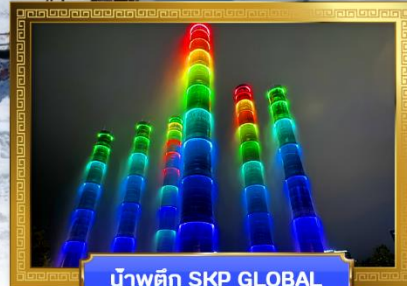
น้ำพุตึก SKP GLOBAL