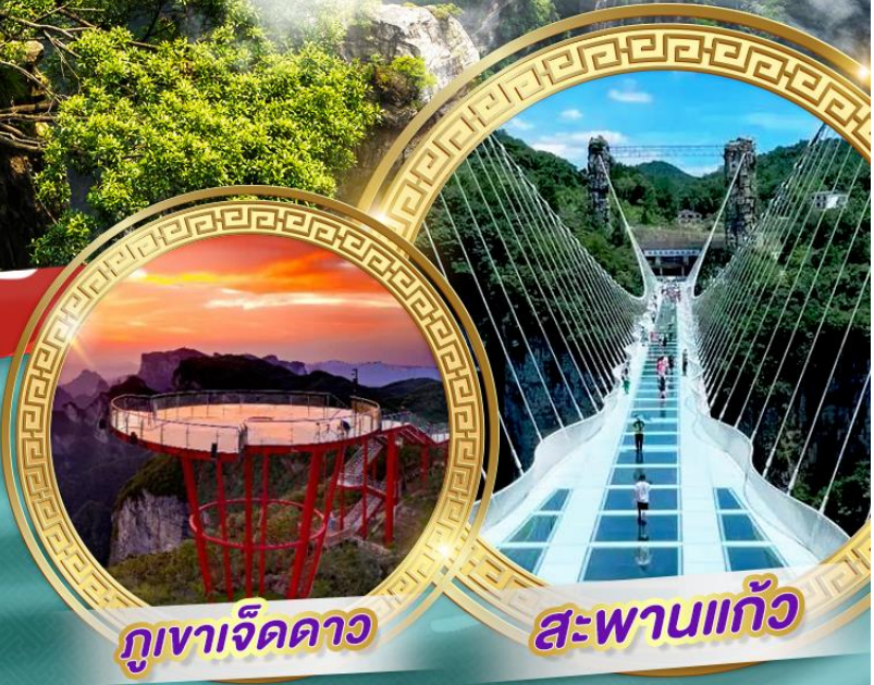
ภูเขาจี้ดดาว

เที่ยวหมู่บ้านโบราณริมน้ำตก “ฟูหลงเจิ้น” ท้าทายยความสูงบนสะพานแก้ว เที่ยวอุทยานจางเจียเจีย ขึ้นสู่ภูเขาจี้ดดาว แวะจุ่ม POPMART ถนนคนเดินหลงซิงอู๋