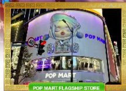
POP MART FLAGSHIP STORE