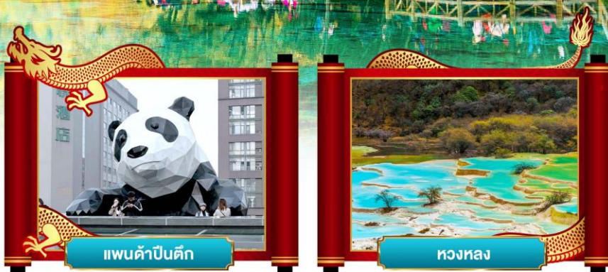
แพนด้าปิ่นตึก