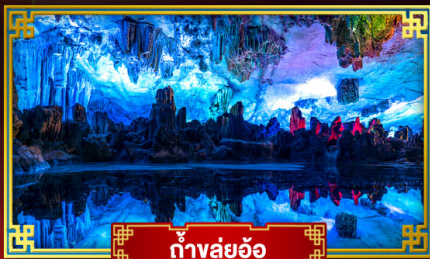
ถ้ำลุย้อ

"ดินแดนแห่งสายน้ำและขุนเขา" สัมผัสประสบการณ์นั่งบอลลูนชมวิวมุมสูง