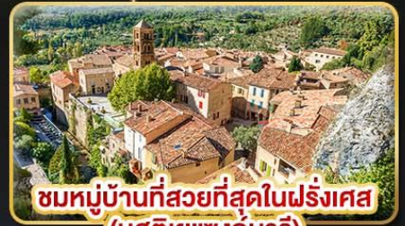
ชมหมู่บ้านที่สวยงามที่สุดในฝรั่งเศส (บูสตีเยแซงท์มารี)