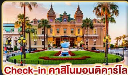
Check-in คาสิโนมอนติคาร์โล