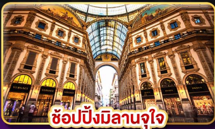
ช้อปปิ้งมิลานจุใจ

มากกว่าการท่องเที่ยว แต่ได้พักผ่อนเต็มที่ โปรแกรมไม่รีบเร่ง