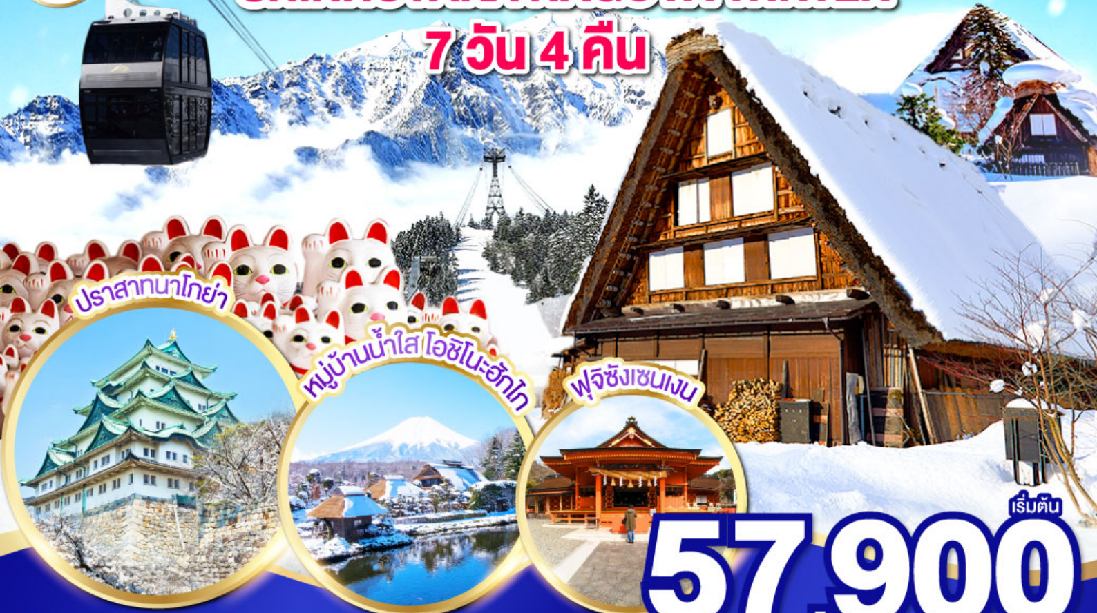
ปราสาทนาโกย่า