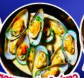
หอยแมลงภู่นิวอิงแลนด์