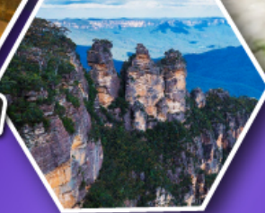
อุทยานบลูเมาส์แท่น