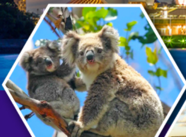
ชมหมีโควาล่า ณ สวนสัตว์ซิดนีย์