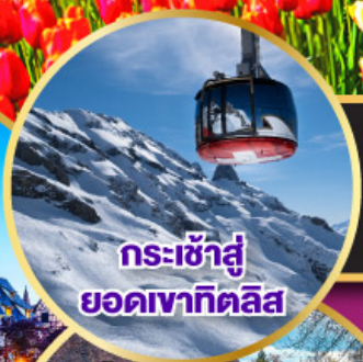
กระเช้าสู่ ยอดเขาคิลิส