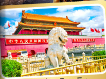
จตุรัสเทียนอันเหมิน