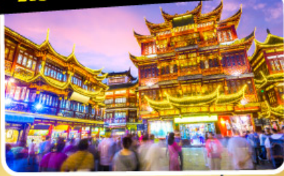
ตลาดร้อยปีเฉิงหวังเมี่ยว