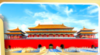
พระราชวังต้องห้าม