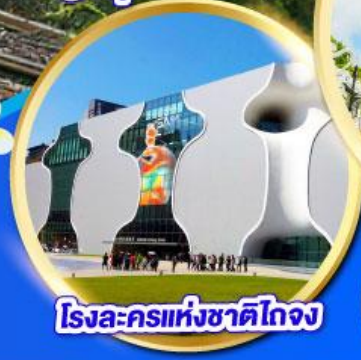
โรงละครแห่งชาติไทจง