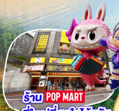
ร้าน POP MART ที่ใหญ่ที่สุดในไต้หวัน