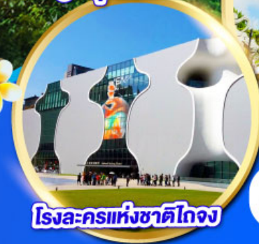
โรงละครแห่งชาติไทจง