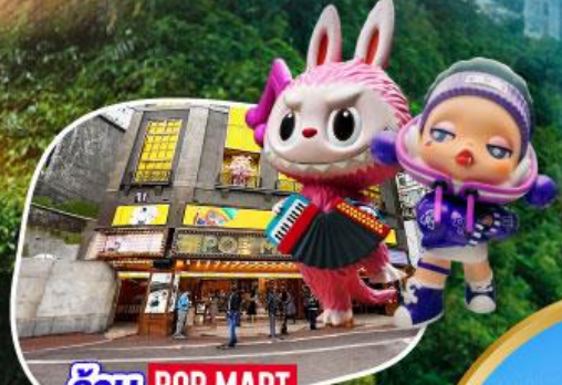
ร้าน POP MART ที่ใหญ่ที่สุดในไต้หวัน