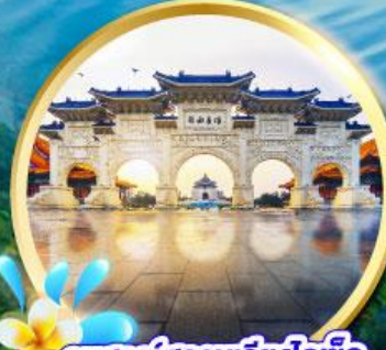
อนุสรณ์สถานเจียงไคเช็ค