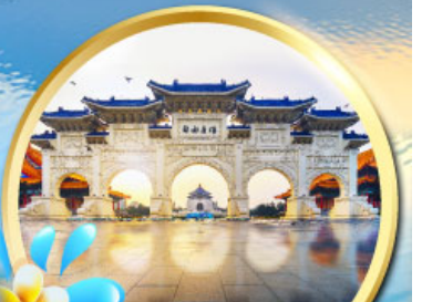
อนุสรณ์สถานเจียงไคเช็ค