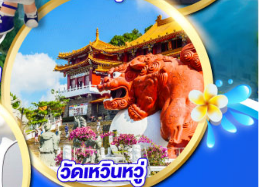
วัดเหวินหวู่