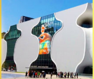
โรจระครแห่งชาติไทจง