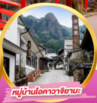
หมู่บ้านโอคาวาจิยามะ