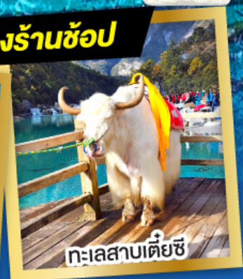
ทะเลสาบเตี้ยซี