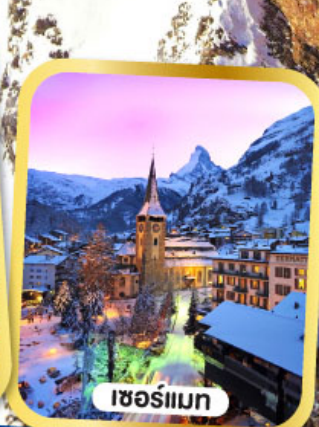
เซอร์แมท