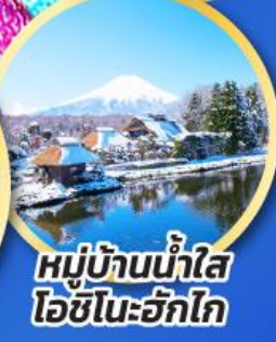
หมู่บ้านน้ำใส ไอชิโนะอัททิก