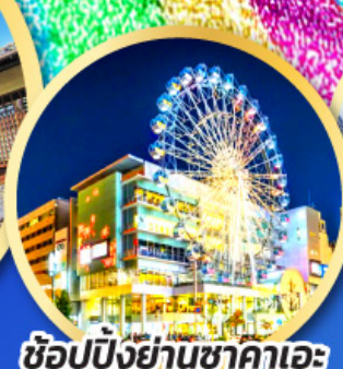
ช้อปปิ้งย่านซากาเอะ