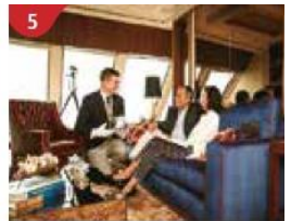
5 The Palace Indulge in European-style butler service and exclusive facilities.