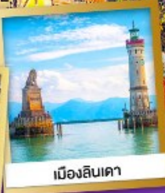
เมืองลินเดา