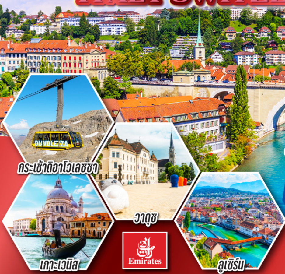
กระเซ้าดีอาโวลเลซซา