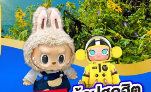
POP MART ซ้อปสุดฮิต