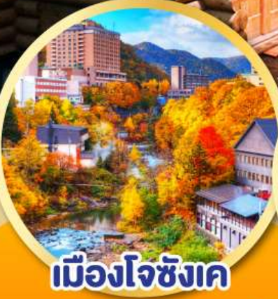
เมืองโจซังเค