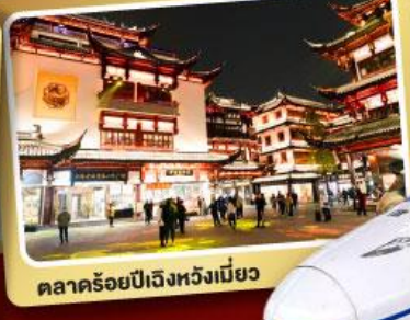
ตลาดร้อยปีเจิ้งหวิงเมี่ยว