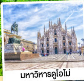
มหาวิหารดูโอโม