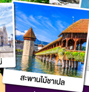
สะพานไม้ชาเปล