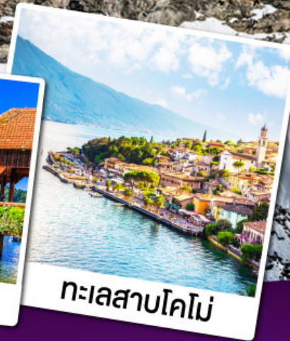
ทะเลสาบโคโม