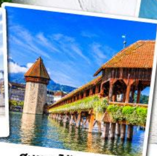
สะพานไม้ชาเปล