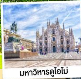
มหาวิหารดูโอโม

09-15 พ.ย. 67 28 ม.ค.-03 ก.พ. 68 12-18 มี.ค. / 11-17 เม.ย. 68 07-13 พ.ค. 68