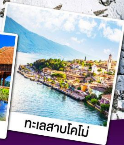
ทะเลสาบโคโม