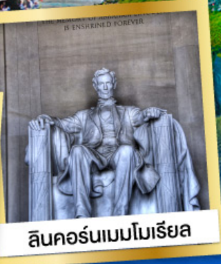
ลินคอล์นเมมโมเรียล