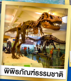
พิพิธภัณฑ์ธรรมชาติ