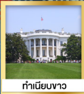
ทำเนียบขาว