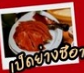
เป็ดย่างซีอาน