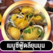
เมนูซีฟู้ดลิ้นยุบ