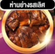
हांอย่างรสเลิศ