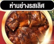
हांอย่างรสเลิศ