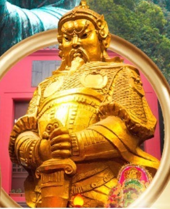
วัดเขกงหมิว