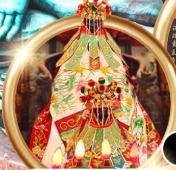
ยืมเงินเจ้าแม่กวนอิมสองห้า