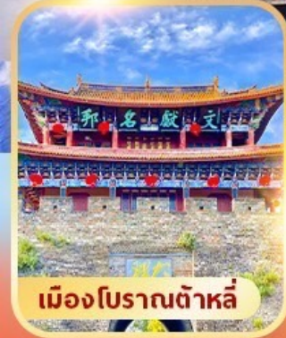
เมืองโบราณต้าหลี่