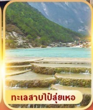
ทะเลสาบปิสุ่ยเหอ