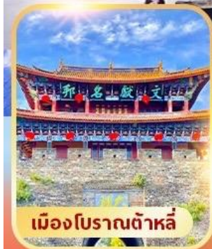
เมืองโบราณต้าหลี่