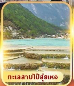
ทะเลสาบปิ๋สุ่ยเหอ