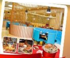
ก๊วยแม่น้ำ + HOTPOT SEAFOOD