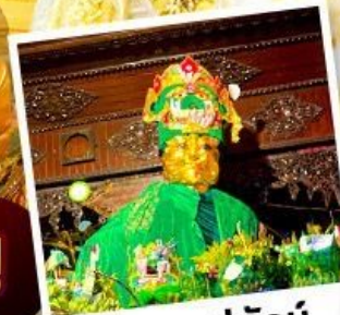
ซอพรแม่ยักย์