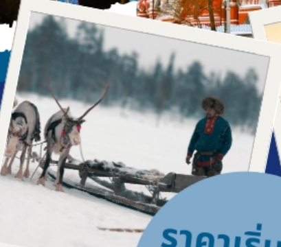
หมู่บ้านซามิ (Sami Village)