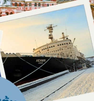
เรือตัดน้ำแข็งเลนิน