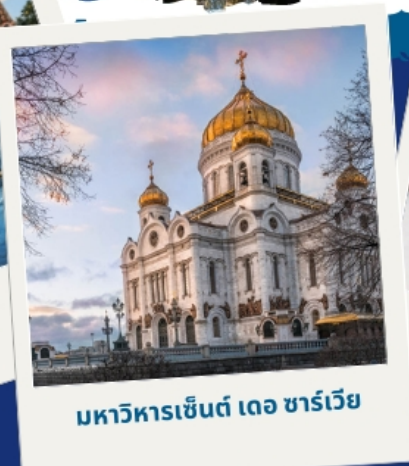
มหาวิหารเซ็นต์ เดอ ชาร์เวีย