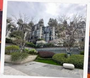
Tian An 1,000 Trees Square