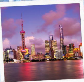
ชมวิวยามค่ำคืน