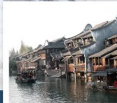
เมืองโบราณผานหลงกู่เจิน