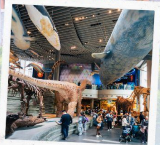
Shanghai Natural history Museum