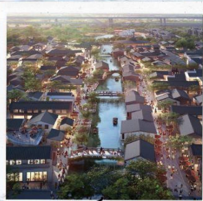
เมืองโบราณ ผานหลงกู่เจิน