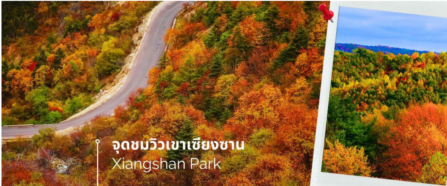
จุดชมวิวเขาเซียงซาน Xiangshan Park

(ระหว่างเดือน ตุลาคม-พฤศจิกายน ของทุกปี) นำท่านชม ใบไม้เปลี่ยนสีที่เซียงซาน จุดชมวิวเขาเซียงซาน(Xiangshan Park) หรือเรียกกันในภาษาอังกฤษว่า Fragrant Hills Park สถานที่ท่องเที่ยวสวยงามในระดับ 4A ตั้งอยู่ในเขตซานเหมิงทางตะวันตกของปักกิ่ง เป็น 1 ใน 4 จุดสำหรับชมใบไม้เปลี่ยนสี ใบไม้สีแดงของ