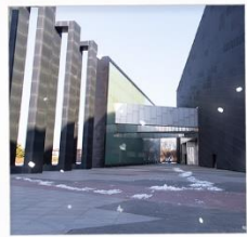
พิพิธภัณฑ์ภาพยนตร์