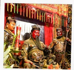
เทพเจ้ากวนอู วัดถวณไท