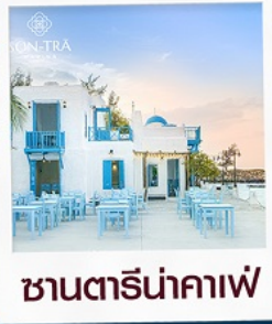
ซานตารีน่ากาแฟ