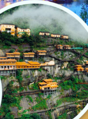
คุมเขาเทวดา