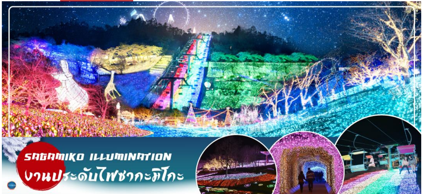
SAGAMIKO ILLUMINATION งานประดับไฟซากะมิโกะ

** ปกติงานประดับไฟซากะมิโกะ จะปิดทำการทุกวันพุธและพฤหัสบดี อังอิงจากงานประดับไฟของปี 2023 - 2024 กรณีที่กรุ๊ปเดินทางเข้าชมตรงวันหยุดของงานประดับไฟซากะมิโกะ ขอปรับเปลี่ยนโปรแกรมเป็น งานประดับไฟที่หมู่บ้านเยอรมัน (Tokyo german village) หลนแทนในวันถัดไป และที่เที่ยววันนี้จะเป็น หมู่บ้านโอชิโนะฮักไก แทน **