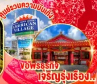
ชมพร้อมความบันเทิง พิพิธภัณฑ์อเมริกันวิลเลจ พิพิธภัณฑ์เจริญรุ่งเรือง!