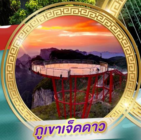
ภูเขาจี้ดดาว