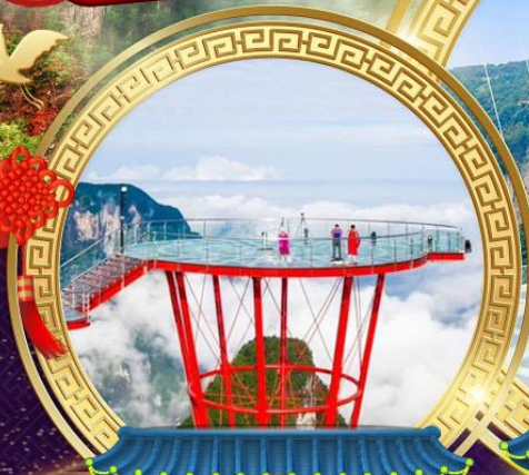
ภูเขาจิดดาว