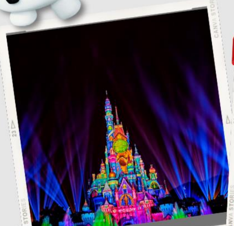
“MOMENTOUS” มหึศจรรย์ขแสงสีแห่งราตรี