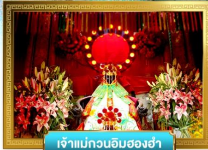
เจ้าแม่กวนอิมสองอำ