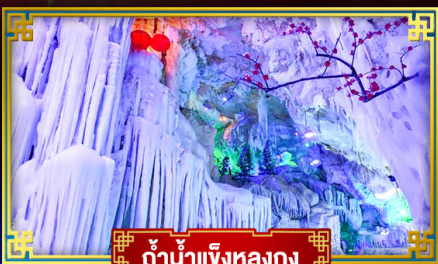
น้ำตกเจียงหลงกวง

"เที่ยว 2 มณฑล กวางซี-กั๋วโจว" สุดอลังการ น้ำตก 2 พรมแดน แหล่งท่องเที่ยวระดับ 5A