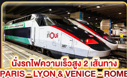
นั่งรถไฟความเร็วสูง 2 เส้นทาง PARIS - LYON & VENICE - ROME

✈️ เดินทาง : 11-20 ก.พ. 68 / 15-24 มี.ค. 68 05-14 เม.ย. 68 / 29-08 พ.ค. 68