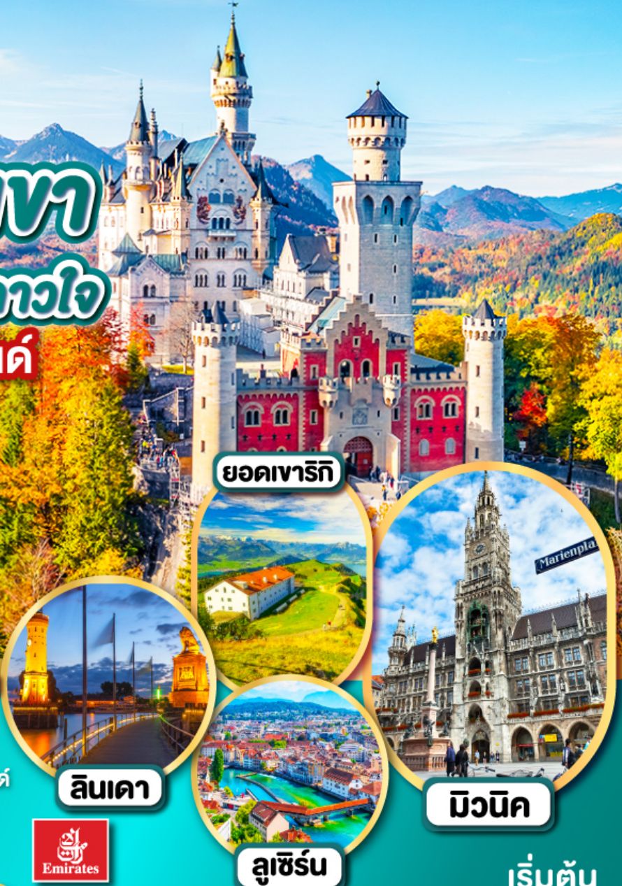
ยอดเขารีกิ