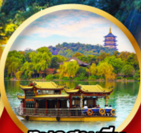
ทะเลสาบชี่หู